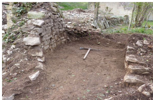
L'arrivée du bief du moulin