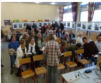
L'assemblée se prépare

A l'ordre du jour, classiquement, les rapports moral et financier de 2011. ont été approuvés à l'unanimité.