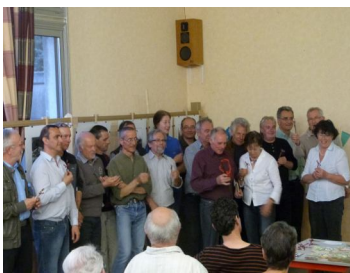
Les ouvriers de la grange décorés de l'ordre du Leuzeu