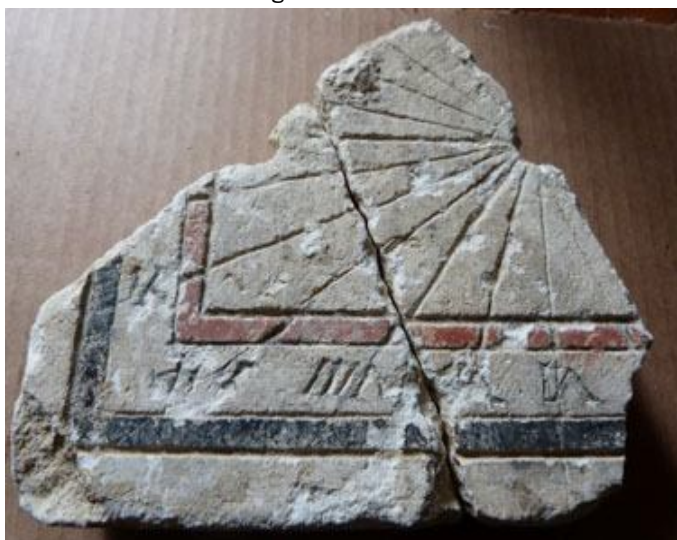
Fragment de cadran solaire du XVIIème s

Nous allons prochainement pouvoir les présenter, les mettre en valeur. Un musée, oui, au Leuzeu !