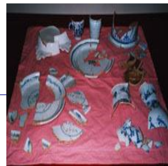
Morceaux de vaisselle (XVIIIème s)