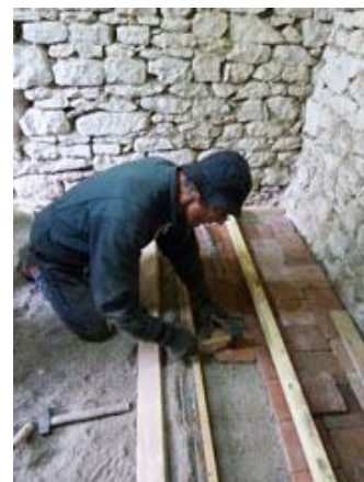
La salle du futur musée aura belle allure :