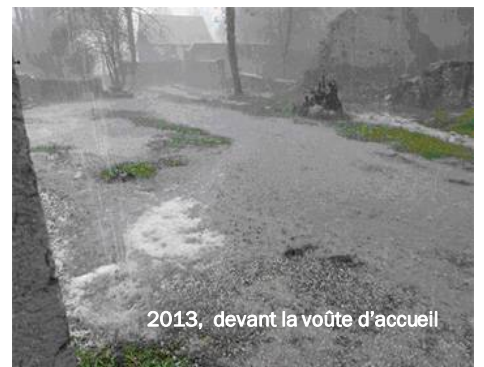
2013, devant la voûte d'accueil