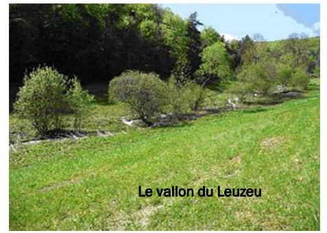
Le vallon du Leuzeu

En 2013, gonflé par de fortes pluies pendant plusieurs jours, Il a envahi la ferme, transformant les espaces en un lac et menaçant de rentrer dans les bâtiments. !!! Capricieux c'est certain.