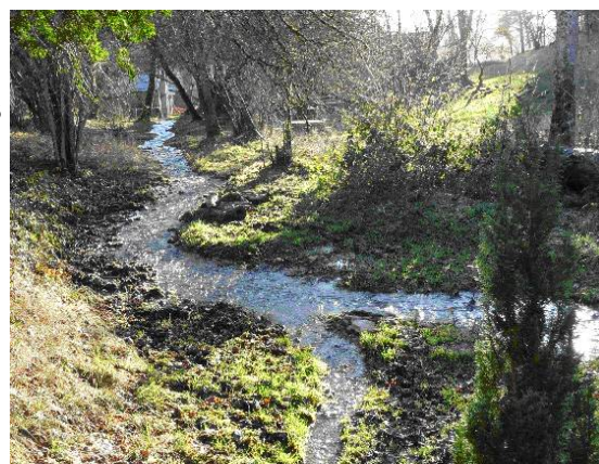
Le Leuzeu depuis la source Saint Andoche

Le «terrier» de 1692 (plan) fait état à cet emplacement d'une digue stockant une quantité d'eau importante utilisée certainement pour des lâchers d'eau alimentant le moulin et peut être pour l'élevage de poissons.