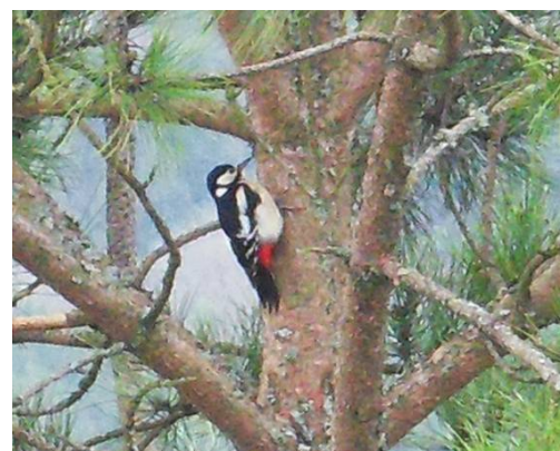
Pic épeiche sur un conifère

Le premier nid de pic noir bourguignon fut trouvé en 1957 dans la vallée du Suzon. Tous les pics sont protégés.