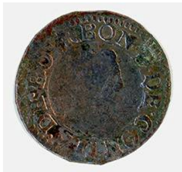
Taille réelle: environ. 2cm