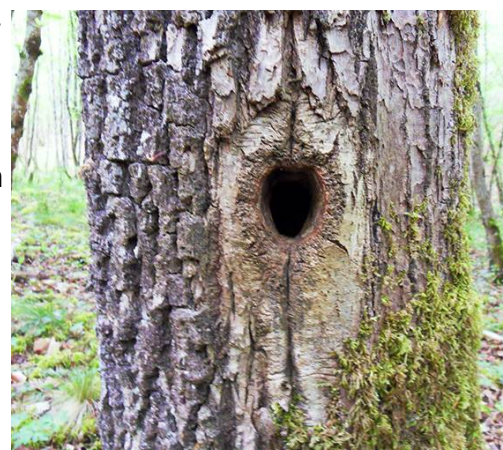
Loge de pic noir sur un hêtre mort