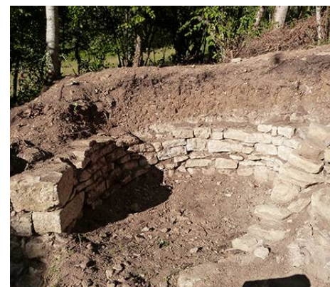
La base de la tour est dégagée