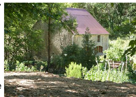
La future terrasse se précise