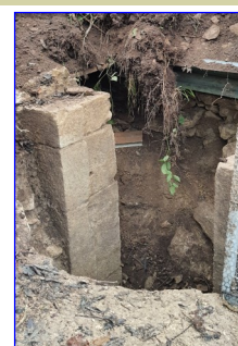
2. L'entrée du moulin dégagée.