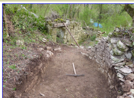
1. Photo prise lors du dégagement de l'ancien lit du ruisseau