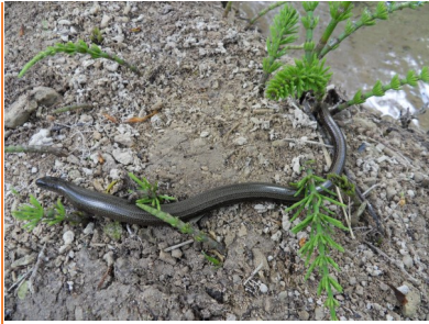
Le long du ruisseau. Juin 2024

L'orvet ( anguis FRAGILIS ) appartient à la famille des ANGUIDÉS .